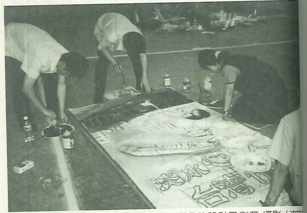
文化賽旗競爭激烈，更考驗作者構圖選色的設計及創意

特別請大家務必要去參觀幾項重要的活動： 一、老街店史展：在老街中正路保安堂等二十幾個店家展出；經調查整理老街店家的歷史資料、創店經歷及經營特色，製作一幅兼具圖像與文字介紹的店史圖，以凸顯該店的特色，並由新舊建築的風貌照片對照，呈現出淡水老街的風華變遷。 二、張鑽傳醫師攝影回顧展：由滬尾攝影學會協助，整理張鑽傳醫師的一生作品精華在其舊宅（中正路142號）展出。 三、老街文物及影像紀錄展：由滬尾文史工作室提供其收藏之老街文物和老街擴寬工程的影像紀錄在滬尾文史工作室館（馬偕街5號）展出。 四、馬偕文物展：由淡水長老教會開放縣定古蹟滬尾偕醫館，展出馬偕文物。 五、糕餅文物展：在三協成糕餅店（中正路81號）展出。 六、老照片展：在義裕排骨店（中正路農會旁）展出。 七、大屯溪生態攝影展：由台北縣河川生態保育協會提供數十幅大屯溪的生態保育紀錄照片，在淡水紅樓展出。 八、歷史建築再利用及淡水老街歷史保存運動展：由淡水社區工作室蒐集整理淡水三級古蹟小白宮及淡水老街歷史保存運動十年來的努力紀錄，配合研討會的舉行，在淡水文化大樓視聽教室公開展出。