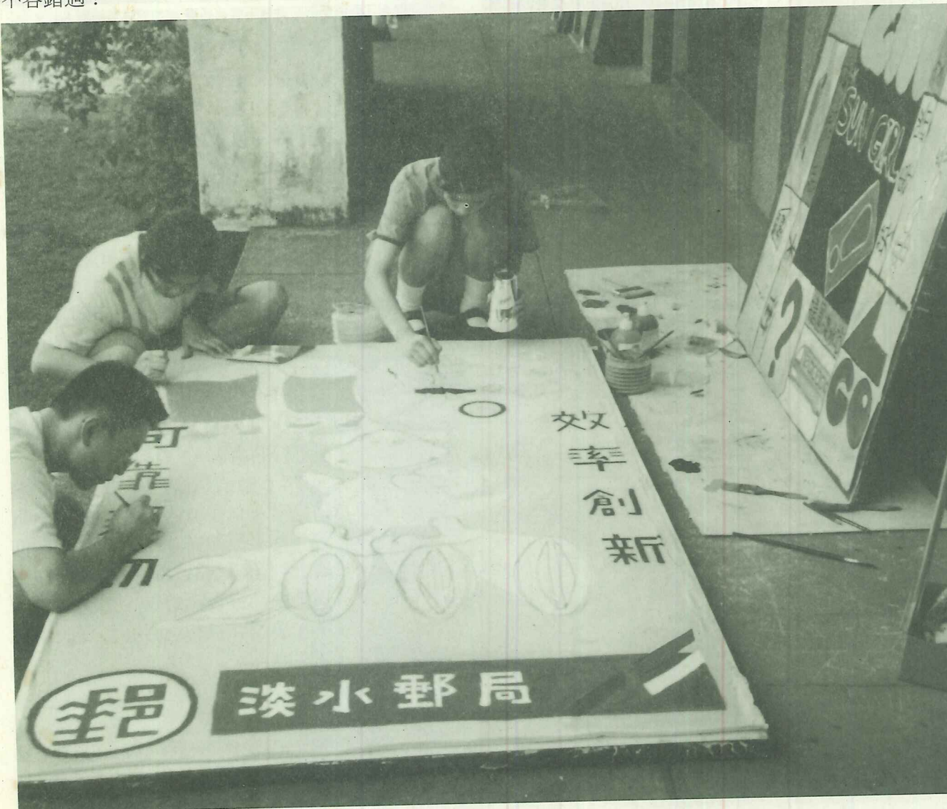
同學們組隊參與繪製賽旗，認真而細心

在五月端陽前夕，主辦單位特別邀請淡水區寶級的漢文大師李天印、洪澤南老師及國內多位著名的吟唱家，結合漢文讀書會的吟友，在六月五日晚上七點，選在淡水老街著名的百年洋樓——紅樓，舉辦「千秋韻事在端陽」古詩吟唱會，將吟唱屈原的離騷國殤、楚辭悲秋及林逢原的淡北八景等作品。這是一場融合古詩吟詠與燈光影像的劃時代嘗試，別開生面，或將重新掀起另一波古詩吟唱的高潮，請大家拭目以待！