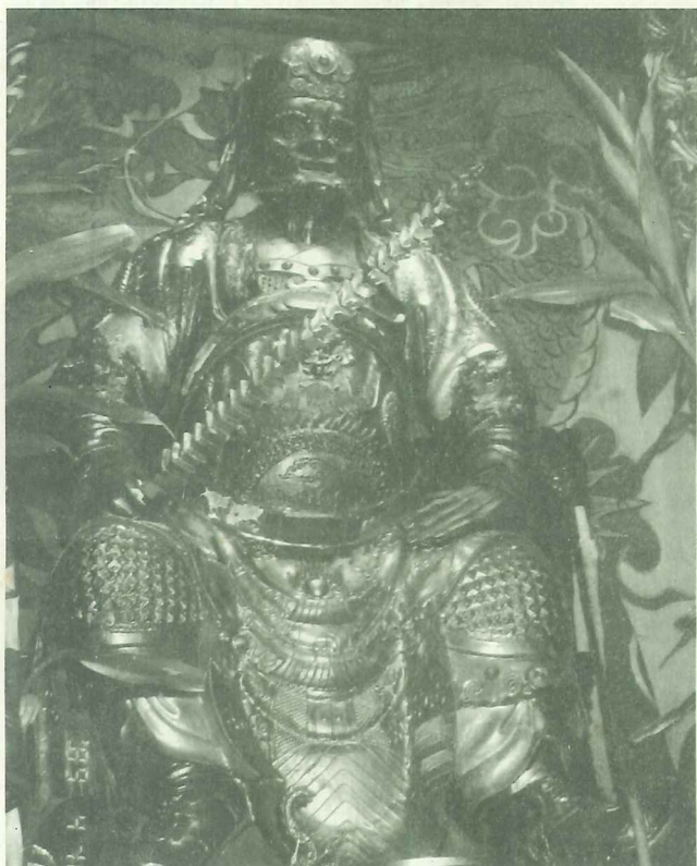
淡水河邊聖江廟供奉的文武尊王張巡將軍 神情威猛氣勢駭人！

若能整合淡水文物資源，舉辦特殊的文物節慶，才有可能讓台灣各界真正體會到淡水的歷史文物之美。